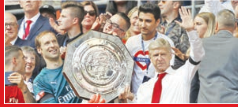
• فينغر وتشيك بيرفغان درج الكاس الخيرية