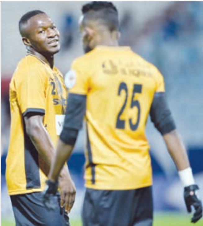
• القادسية ينظر الكثير من محترفي اليوم