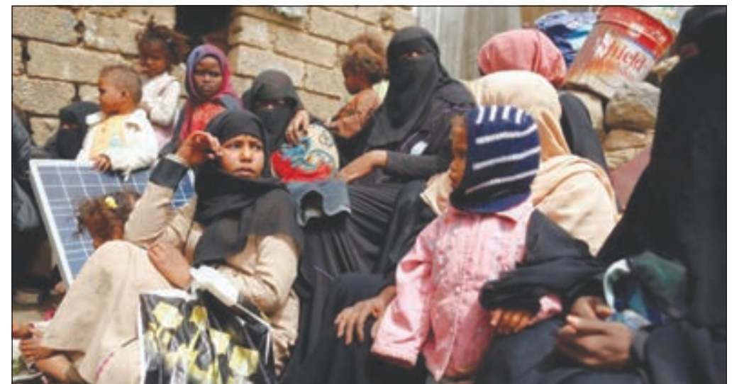
• أطفال ونساء نازحون من مدينة الحديدة

• تلفزيون المسيرة: «التحالف» نفذ 30 ضربة جوية أمس