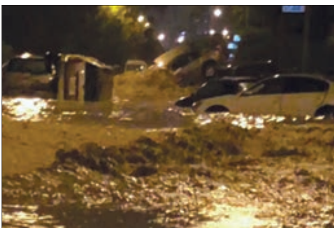
• السيارات تسبح في الشوارع

• وزير الأشغال استقال: يؤسفني ما لحق بالمواطنين من أضرار • نزول الجيش و«الحرس» للشارع لإنقاذ العالقين