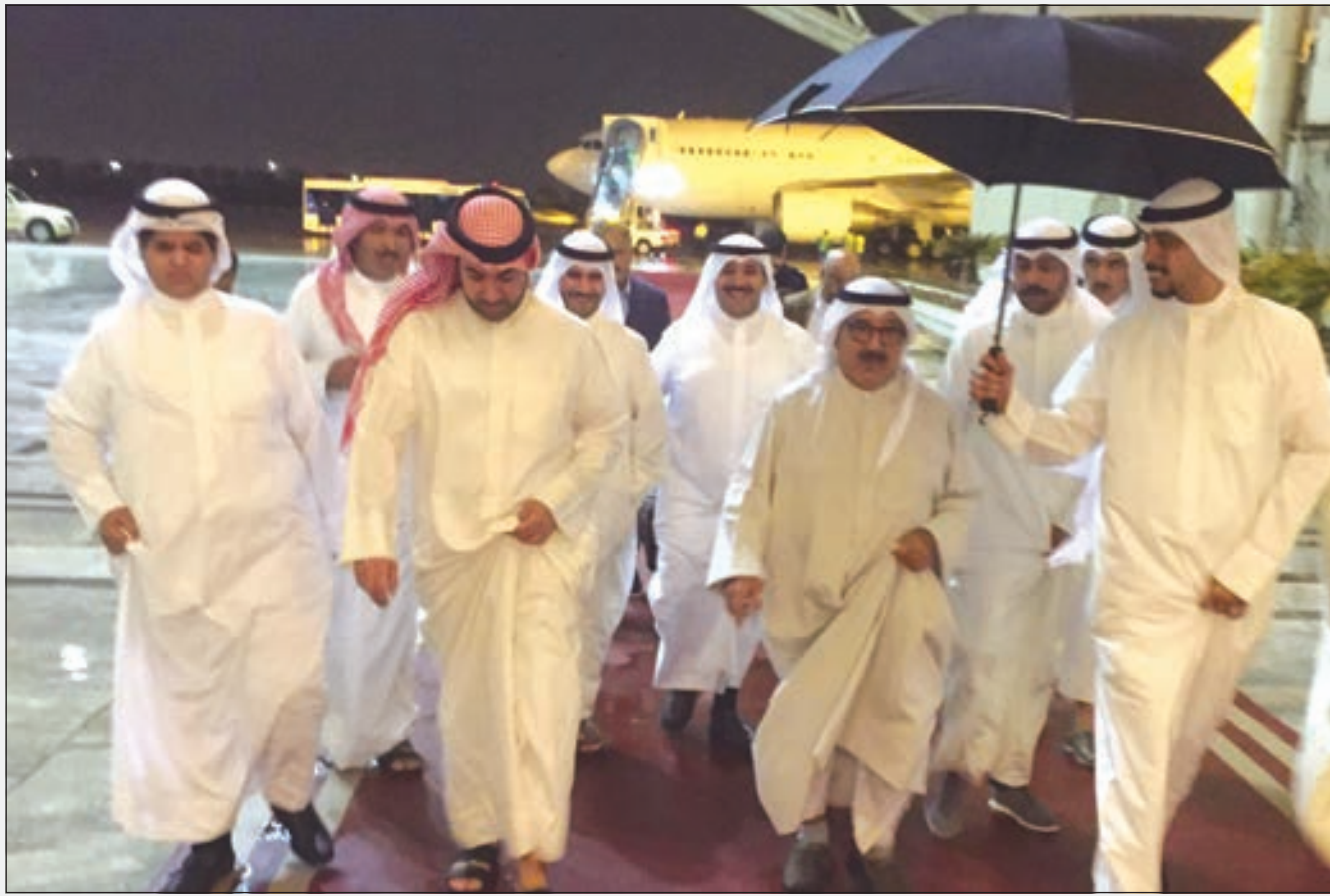
• الشيخ ناصر الصباح لدى وصوله مساء أمس... حيث هطول أمطار الخير

كتب محسن الهيلم: عاد مساء أمس إلى البلاد النائب الأول لرئيس مجلس الوزراء وزير الدفاع الشيخ ناصر الصباح، ليوصل ولباشر مهامه وأعماله. وأعرب الشيخ ناصر الصباح عن خالص تقديره وشكره لحرص واهتمام والد الجميع، صاحب السمو أمير البلاد الشيخ صباح الأحمد وسمو ولي العهد الشيخ نواف الأحمد وسميد أسرة الصباح رئيس الحرس الوطني سمو الشيخ سالم العلي، ولأسرة آل الصباح الكرام على متابعتهم الدائمة له خلال فترة العلاج، كما شكر المواطنين والمواطنات وابناءه وإخوانه منتسبي وزارة الدفاع. وكان النائب الأول صرح لدى وصوله بما يلي: بداية أود أن أنتهز هذه الفرصة لأعرب عن خالص تقديري وشكري لحرص واهتمام والد الجميع سيدي