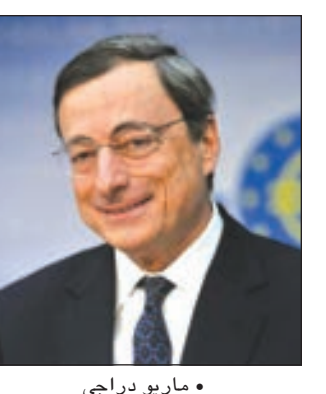
• ماريو دراغي

معدل التضخم متراجحاً، «نعرف أننا حينما نضع السياسة أننا نفكر بشأن تلك الأشياء ونقوم باستدئام نوعاً من المنطق في تحديد الشكل الذي يجب أن يكونوا عليه». وأكد باول على ثقته بأن الاقتصاد الأميركي يمكنه أن يحقق مزيد من النمو بشكل أسرع، «نحن ملتزمون بخدمة الشعب في مجتمع غير حزبي وبطريقة مهنية وبطريق توصل ما نفعله وما يجب أن نقوم به بنفس الوضوح قدر الإمكان». وفيما يتعلق ببدء سوق الأسهم