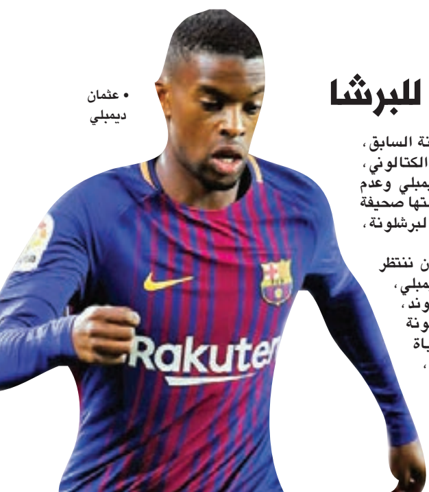
• عثمان ديمبلي

يذكر أن سكالوني يتولى تدريب منتخب الأرجنتين بصفة مؤقتة، منذ إقالة المدرب خورخي سامباولي عقب مونديال روسيا.