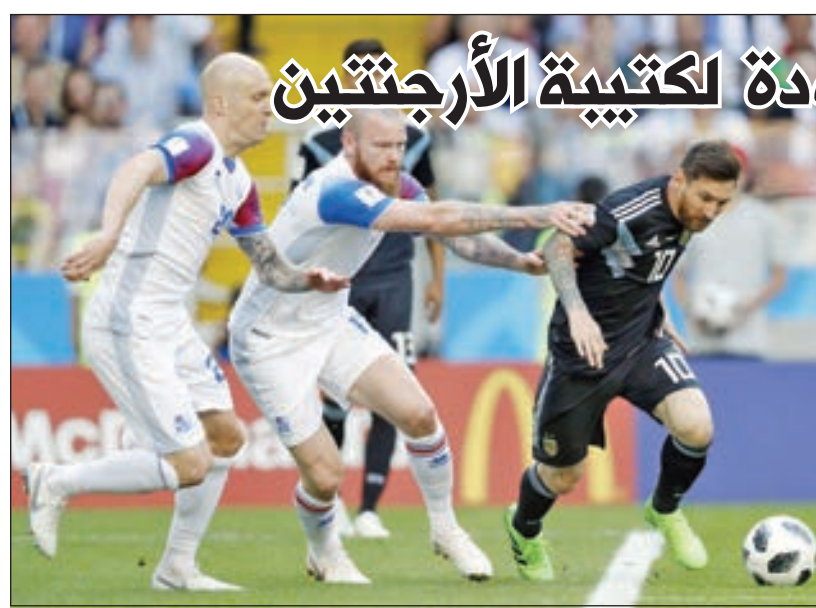
• ميسي يحاول المرور بالكرة

وتابع: «هذا نراه منذ البداية، لا يجب أن ننظر 3 مواسم حتى نحكم على مستوى عثمان ديمبلي، لقد قدم مباريات رائعة مع بوروسيا دورتموند، ولكن ليس بشكل كبير». وأوضح: «برشلونة فريق كبير، كان من الخطأ عدم معرفة حياة ديمبلي خارج الملعب قبل التعاقد معه، لقد واجهت وضعاً مماثلاً في ريال مدريد، كان هناك من يأتي متأخراً ولا يتعلم من الأخطاء، ذهبت إلى قادة الفريق وطلبت منهم الحديث معه».