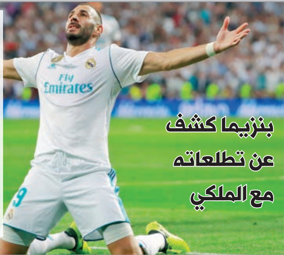
• بنزيما يحتفل بهدفه

وسجل بنزيما 10 أهداف وصنع 3 لزملائه في 18 مباراة بـ4 بطولات مختلفة الدوري وكأس الملك وكأس السوبر الإسباني ودوري أبطال أوروبا.