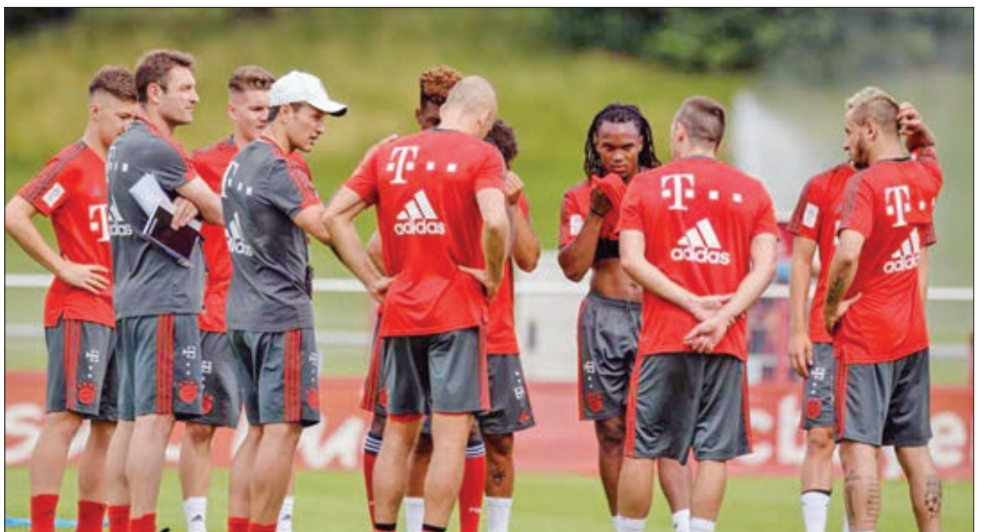
• كوفاتش يوجه لاعبي الباييرن في التدريب