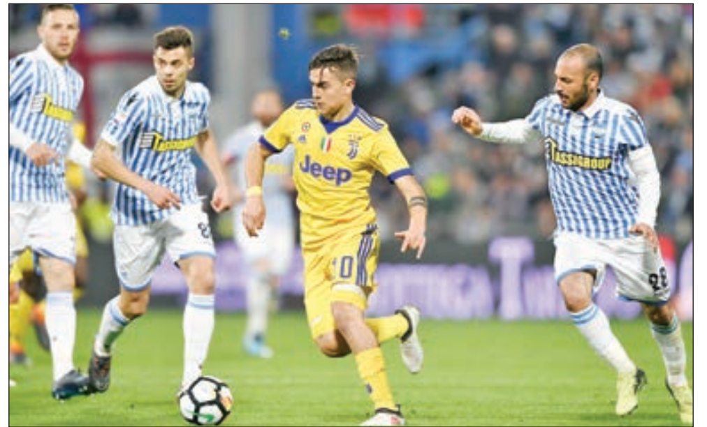
• ديبالا ينطلق وسط لاعبي سبال

ويعاني يوفنتوس من وجود نقص في لاعبي خط الوسط لا سيما وأن الألماني إيمري كان استأنف التدريبات لتوه بعد خضوعه لجراحة الغدة الدرقية، بينما يعاني مواطنه سامي خضيرة من إصابة في الكاحل تلقاها خلال التدريبات، واضطر فيديريكو بيرنارديسكي لترك المنتخب الإيطالي بسبب مشاكل عضلية. ومن المرجح أن يلعب في خط