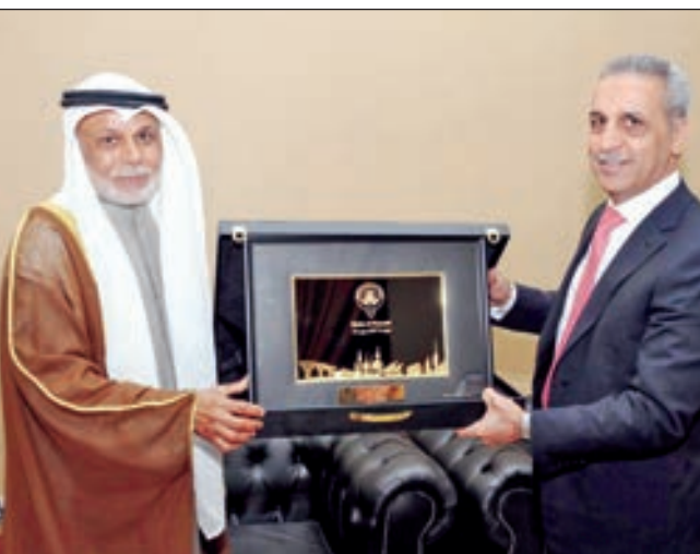
• يوسف المطاوعة يقدم درعاً لرئيس مجلس القضاء العراقي التابعة لكل محكمة ووظيفتها. السلطات الثلاث التي نص عليها ميثاق القضاء الكويتي هو إحدى الدستور الكويتي.

شدد رئيس المجلس الأعلى للقضاء رئيس المحكمتين الدستورية والتعمير المستشار يوسف المطاوعة أمس على أهمية التعاون بين الكويت والعراق في المجال القضائي على نحو يخدم مصالح المواطنين في البلدين الشقيقين.