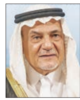
• تركي الفيصل

أعلن الرئيس الأسبق للاستخبارات السعودية الأمير تركي الفيصل أن ولي العهد السعودي الأمير محمد بن سلمان باقٍ في منصبه، وذلك في معرض رده على سؤال شبكة «سي إن إن» عما إذا كان منصبه في خطر.