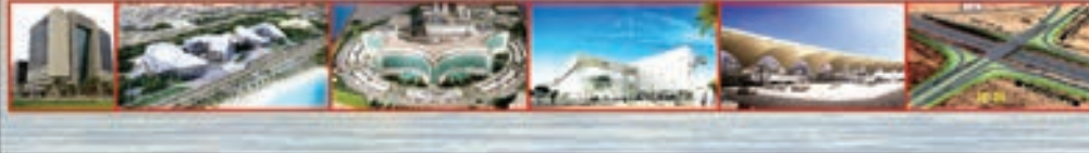
• سمو الأمير لدى افتتاحه مستشفى جابر