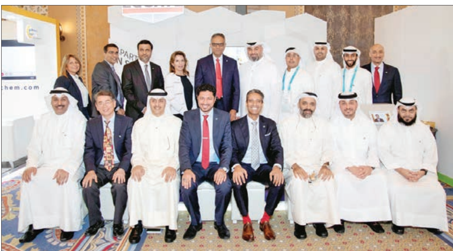
• المشاركون في المنتدى

بشكل كيميائي كمادة خام في عمليات تصنيع العيوبات البلاستيكية، وهي أعلى نسبة تم تحقيقها حتى الآن في جميع أنحاء العالم». وأضاف: «كأول جهة مقرها في الشرق الأوسط وتستفيد من مصادر الغاز الصخري في الولايات المتحدة، فمن المقرر أن يتم إطلاق مصنعنا الواقع على ساحل الخليج الأمريكي لإنتاج مادة الإيثيلين جلايكول خلال فترة الربع الرابع من عام 2019، وذلك بطاقة إنتاجية إجمالية تبلغ 750 ألف طن سنويا».