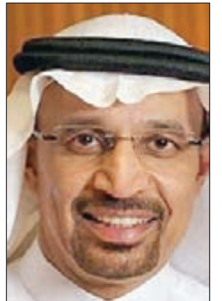
• خالد الفالج

وكان الفالج قال في نوفمبر إن وفرة إمدادات النفط ربما تتطلب من أوبك وحلفائها أن يخفّضوا خطوات خفض الإنتاج في 2019. وجرى إعفاء نيجيريا من الجولة السابقة من التخفيضات، التي بدأت في عام 2017، بسبب تراجع إنتاج كبيرة في الإنتاج ناجمة عن الاضطرابات. وتعافى إنتاج البلاد منذ ذلك الحين.