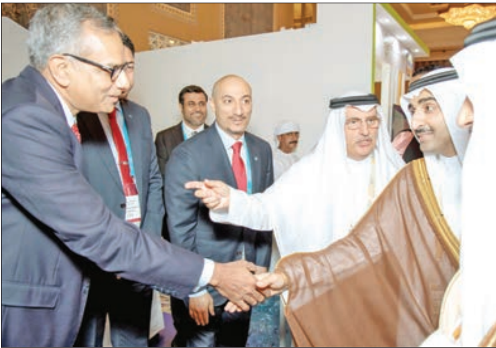
• الشيخ محمد آل خليفة خلال المنتدى السنوي الثالث عشر

تبحث في فرص وتحديات الرقمنة، وأمن الشبكات، والتجارة في زمن الحماثة المتنامية. بالإضافة إلى دور المرأة في القطاع. كما تم تخصيص جلسة تبحث بالاقتصاد الدائري تحت عنوان كيف «ننكر دائريا» ونخطط للمستقبل التي تعد فرصة طيبة استثنائية للإطلاع على أحدث التحديات والتوجهات في هذا القطاع وأفضل السبل لمعالجتها. واستضاف المنتدى أيضاً الدورة التاسعة لبرنامج «قادة الغد» الذي أطلقته «جيبكا» في سياق برامج الخدمة المجتمعية التي تروجها، وهو عبارة عن منصة توفر لطلاب الجامعات والكليات في اختصاصات العلوم والتكنولوجيا والهندسة والرياضيات فرصة للتعرف على فرص العمل في هذا القطاع مستقبلاً.