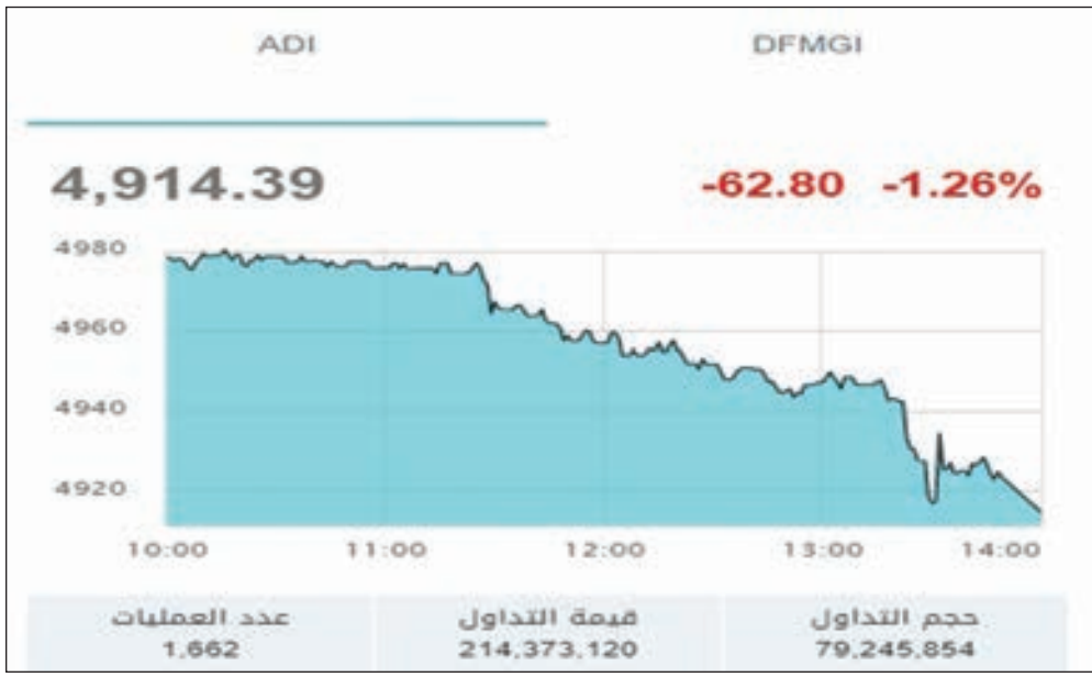
• مؤشر أبوظبي

أنهى المؤشر العام لسوق أبوظبي المالي تعاملات جلسة أمس على تراجع: بفعل هبوط قطاعي البنوك والعقارات. ونزل المؤشر العام بنسبة 0.86% إلى مستوى 4872.08 نقطة ليفقد من خلالها 42.30 نقطة. وجرى التعامل على 1.13 مليون سهم بقيمة 214.373.120 مليون درهم موزعة على 902 صفقة. ونزل قطاع البنوك بنسبة 1.44% بفعل هبوط بنك أبوظبي التجاري بنحو 1.93%، وأبوظبي الأول بنسبة 1.58% وانخفض قطاع العقارات بنسبة 0.87% بعد هبوط سهم الدار العقارية بنسبة 1.12%. وفي المقابل ارتفع قطاع الطاقة بنسبة 1.44% مدفوعاً بسهم طاقة متصدر الارتفاعات بنسبة 10.34%. وارتفع قطاع السلع بنحو 1.06% بدعم من سهم أغذية المرتفع بنسبة 1.61%. وكان سهم الدار العقارية الأنشط تداولاً من حيث القيمة والحجم، بنحو 51.47 مليون درهم، من خلال التداول على 28.8 مليون سهم.