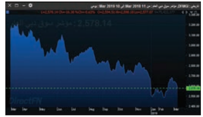
• مؤشر دبي

بنسبة 1.22%، وفي المقابل انخفضت الخدمات بالارتفاعات بنسبة 0.22% بدعم من سهم تبريد المرتفع بنسبة 0.59%. وكان سهم دبي الإسلامي