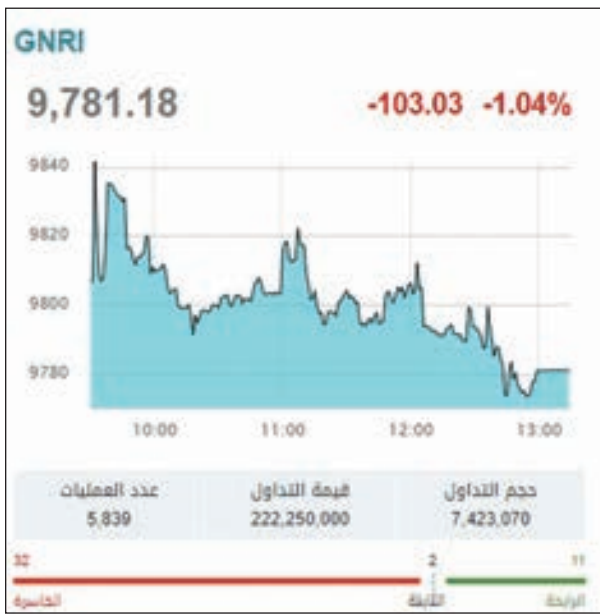
• مؤشر قطر

أنهت بورصة قطر تعاملات أمس الأحد في المنطقة الحمراء للجلسة الرابعة على التوالي، متأثرة بهبوط 5 قطاعات. وانخفض المؤشر العام بنسبة 1.12% ليصل إلى المستوى 9769.04، خاسراً 12.14 نقطة عن مستويات الخميس الماضي. وتراجعت التداولات أمس، حيث انخفضت السيولة إلى 203.47 ملايين ريال، مقابل 222.25 مليون ريال يوم الخميس. وانخفضت أحجام التداول عند 7.17 ملايين سهم، مقارنة بـ 7.42 ملايين سهم في الجلسة السابقة. وهبط بالجلسة 5 قطاعات، وهي: العقارات، والبنوك، والنقل، ثم الصناعة، والتأمين، فيما ارتفع الاتصالات والبضائع. وتصدر العقارات القطاعات المتراجعة بـ 2.29%، بضغط تصدّر سهم إزدان القائمة الحمراء بـ 3.96%، وهبوط مزايًا 0.28%. وتراجع البنوك 0.53%، لانخفاض عدة أسهم بينها الوطني بـ 0.67%. وعلى الجانب الآخر ارتفع البضائع 0.73%، مدفوعاً بنمو 6 أسهم تقدمها السينما متصدر الارتفاعات بـ 9.87%. وتصدر سهم مسعيد المنخفض 0.22% نشاط التداول على كافة المستويات بحجم بلغ 1.33 مليون سهم، وسيولة بقيمة 23.91 مليون ريال.