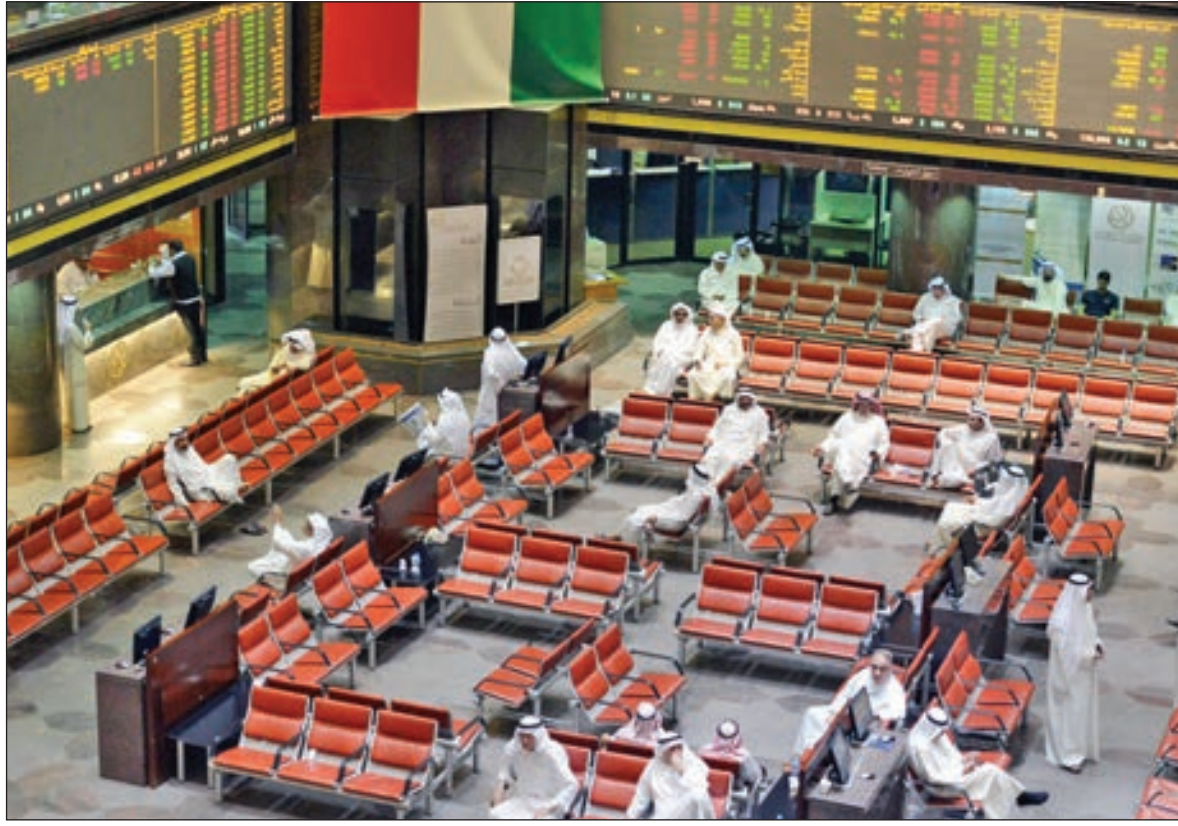
• الكويت الوطني حقق أنشط سيولة بقيمة 3.63 ملايين دينار

وسجلت مؤشرات 5 قطاعات تراجعاً أمس بصدارة البنوك بنسبة 0.8%، فيما ارتفعت مؤشرات 6 قطاعات أخرى يتصدرها السلع الاستهلاكية بنحو 3.2%. وجاء سهم «ياكو» على رأس القائمة الحمراء بانخفاض نسبته 8.54%، فيما تصدر سهم «مراكن» القائمة الخضراء بنمو معدله 13.11%. وارتفعت سيولة البورصة أمس 7.6% إلى 27.78 مليون دينار مقابل 25.82 مليون دينار بالجلسة السابقة، كما ارتفعت أحجام التداول 3.3% إلى 164.34 مليون سهم مقابل 159.12 مليون سهم يوم الخميس الماضي. وحقق سهم «الكويت الوطني» أنشط سيولة بالبورصة بقيمة 3.63 ملايين دينار متراجعا 1.09%، فيما تصدر سهم «عقارات الكويت» نشاط الكميات بتداول 25.76 مليون سهم مرتفعاً 2.75%.