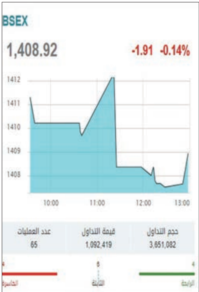
• مؤشر البحرين

تراجع سوق البحرين المالي، خلال تعاملات أمس الأحد، بضغط من أسهم البنوك. وبنهاية التعاملات، انخفض سوق البحرين المالي بنحو 0.22%، إلى المستوى 1405.84 نقطة، خاسراً 0.22 نقطة. وهبط وحيداً قطاع البنوك 0.52%، بقيادة سهم البحرين الوطني بنسبة وصلت إلى 2.42%. ونفذ مستثمرو السوق 6 صفقات على السهم بقيمة 11.55 ألف دينار، بتداول 18.96 ألف سهم. وبلغ إجمالي التعاملات 1.59 مليون سهم، بقيمة 507.06 آلاف دينار عبر تنفيذ 67 صفقة على مدى الجلسة. وفي المقابل، ارتفع بتلك الخدمات للصعود 0.40%.