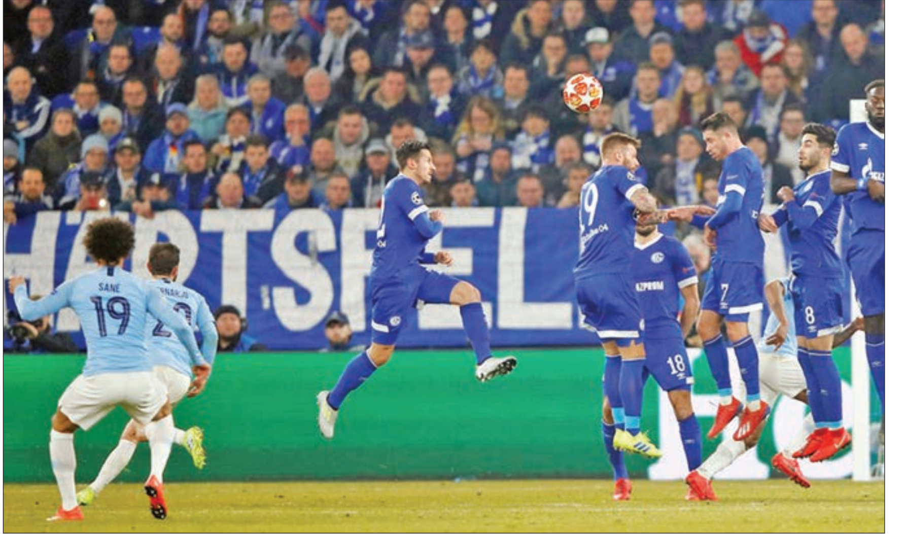
• دفاع شالكه يفشل في التصدي لتسديدة ساني

تشيلسي، فيما انحصر الصراع بينه وبين ليفربول في الدوري الممتاز حيث يتصدر بفارق نقطة 74 مقابل 73، ووصل الى الدور ربع النهائي من كأس انكلترا، ولكن تبقى المسابقة القارية الأم الأكثر رغبة لرجال غوارديولا وتوجب على هذا الأخير أن يواجه أسئلة الصحافيين قبل مباراة الذهاب أمام شالكه التي تحولت معظمها حول قسلة في الفوز باللعب القاري منذ ثمانية أعوام، بعدما كان نجح في تحقيق هذا الإنجاز مرتين في غضون ثلاثة أعوام مع برشلونة الإسباني عامي 2009 و2011. ويخوض سيتي مباراة الإياب أمام شالكه في خضم الأزمة التي تعصف به بعدما أعلن الاتحاد الأوروبي الاسبوع الماضي أنه فتح تحقيقا حول ما إذا كان النادي الإنجليزي