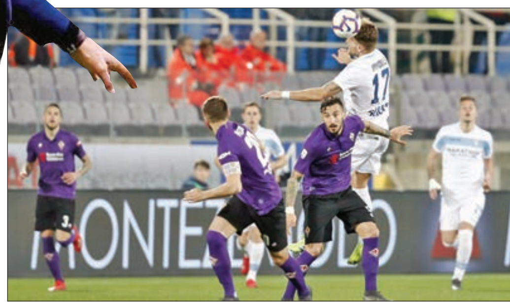
• صراع على الكرة بين لاعبي فيورنتينا ولاتسيو

وعلى ملعب «تريكولوري»، وبعد شوط أول سلبي بين الفريقين، وضع المهاجم الشاب دومينكو بيراردي، أصحاب الأرض في المقدمة في الدقيقة 52. ظلت هذه النتيجة قائمة حتى قبل نهاية