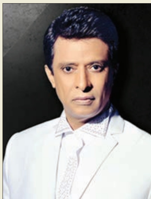
• احمد فتيحي

كشفت النجمة بلقيس عن موعد حفلها المقبل بمركز جابر الثقافي، وجاء ذلك عبر حسابها الرسمي بموقع تبادل الصور والفيديوهات «انستغرام»، وعلقت قائلة: «انتظركم في حفل من الطراز الرفيع في حبيبي الكويت بمركز جابر الثقافي «دار الأوبرا» بحفل يجمعني مع أحد الفنانين الكبار أحمد فتيحي. تاريخ 4 ابريل 2019. ما شاء الله التذاكر خلصت بنسبة 70% قبل الإعلان عن الحفل». يذكر أن الفنانة اليمنية بلقيس طرحت سابقاً أغنية «قالوا أشياء»، وهي من كلمات مشاري أبراهيم، وألحان متعب الفرج، وتوزيع حسام كامل، كما كسرت الأغنية حاجز الـ 3 ملايين مشاهدة عبر موقع الفيديوهات العالمي «يوتيوب».