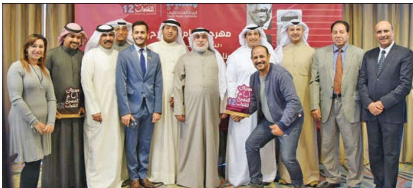
• الكرمون من المؤتمر

و العام المقبل سيشهد إطلاق مهرجان «عدسة»