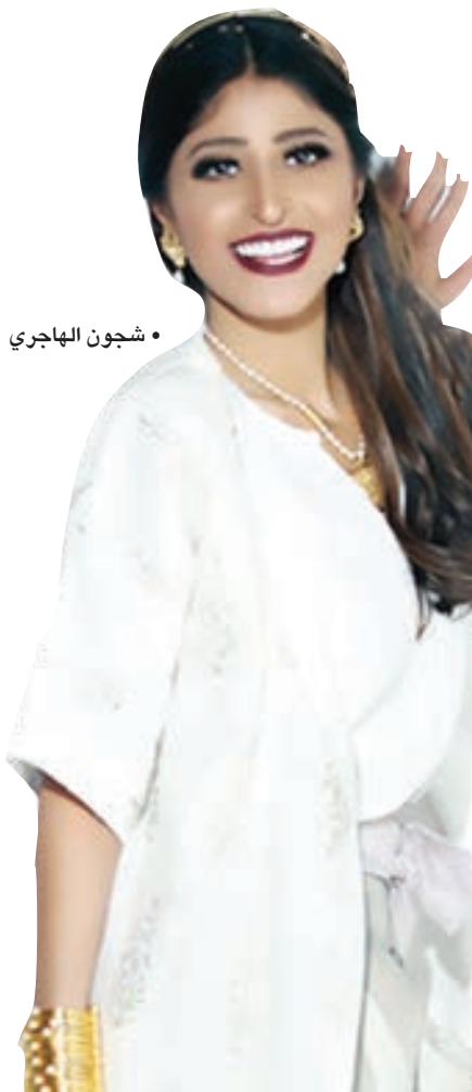
• شجون الهاجري

كشفت النجمة بلقيس عن موعد حفلها المقبل بمركز جابر الثقافي، وجاء ذلك عبر حسابها الرسمي بموقع تبادل الصور والفيديوهات «انستغرام»، وعلقت قائلة: «انتظركم في حفل من الطراز الرفيع في حبيبي الكويت بمركز جابر الثقافي «دار الأوبرا» بحفل يجمعني مع أحد الفنانين الكبار أحمد فتيحي. تاريخ 4 ابريل 2019. ما شاء الله التذاكر خلصت بنسبة 70% قبل الإعلان عن الحفل». يذكر أن الفنانة اليمنية بلقيس طرحت سابقاً أغنية «قالوا أشياء»، وهي من كلمات مشاري أبراهيم، وألحان متعب الفرج، وتوزيع حسام كامل، كما كسرت الأغنية حاجز الـ 3 ملايين مشاهدة عبر موقع الفيديوهات العالمي «يوتيوب».