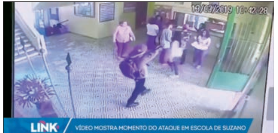
• المراهق أثناء فتح النار على أطفال المدرسة

أعلنت الشرطة في مدينة ساو باولو البرازيلية مقتل 9 أشخاص وإصابة 17 طفلا في مدرسة ابتدائية على يد مراهق، وبمساعدة آخر، قام باستخدام آلة حادة لقتل المصابين. وأضاف أن القتلى هم 5 تلاميذ وموظف في المدرسة وشخص كان يقف خارجها. إضافة إلى المهاجرين الذين انتحرا، مية 17 شخصاً، معظمهم أطفال، أصيبوا أيضاً بأعيرة نارية في المدرسة ونقلوا إلى مستشفيات.