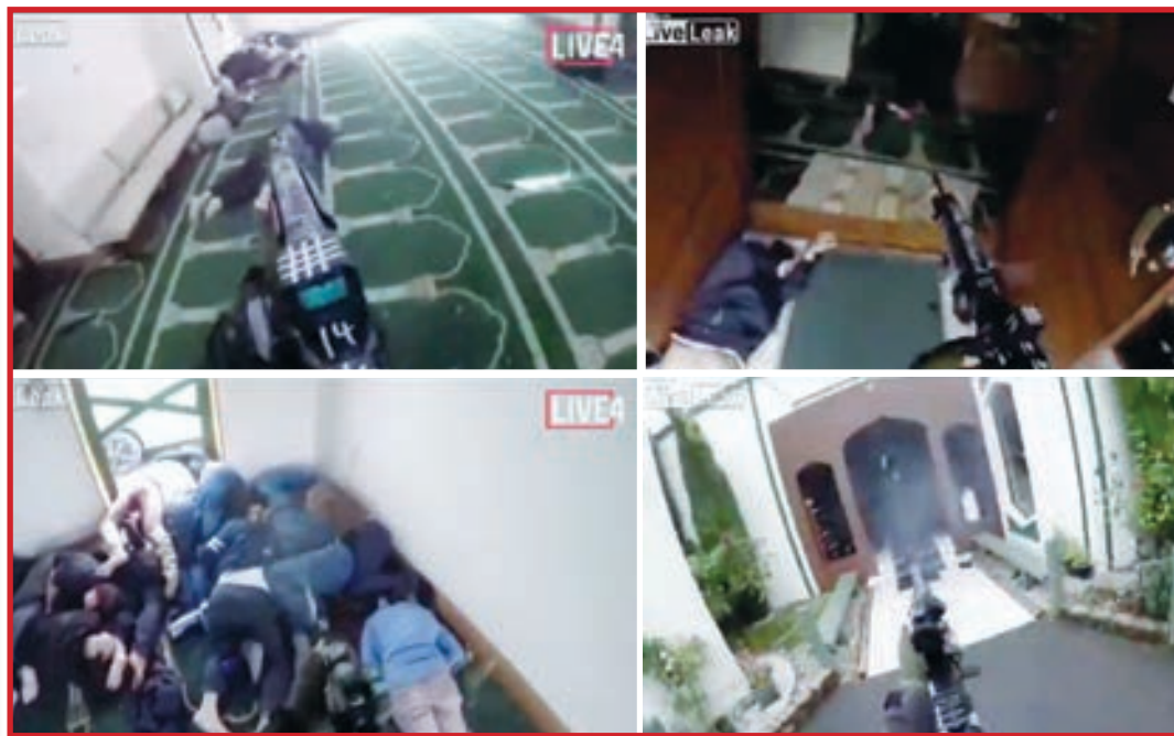
• منفذ الهجوم الإرهابي أثناء ارتكابه المجزرة على طريقة لعبة PUBG وبث الفيديو على الهواء