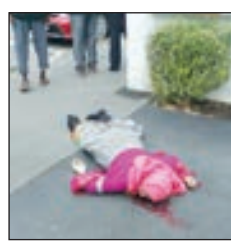
• جثة أحد الضحايا