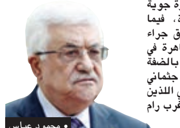
• محمود عباس

دعا عباس حركة «حماس» إلى «العودة لحضن الشرعية الفلسطينية والى الالتزام باتفاقات عام 2017 لدرء ويلات الحروب». من جهتها أعلنت وزارة الصحة الفلسطينية