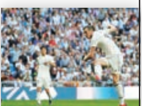
زيدان يستهل الولاية الثانية بالفوز على سيلتا فيغو في الليغا