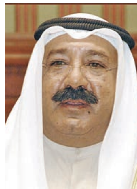
• الشيخ ناصر الصباح