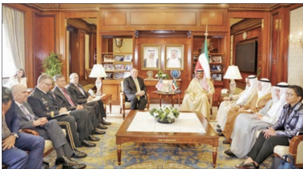
● الشيخ صباح الخالد مع وزير الخارجية الأميركي خلال جلسة المباحثات الرسمية

في مجلس الأمن حيال تلك القضايا. من جانبه أكد وزير خارجية الولايات المتحدة مايك بومبيو، أن الكويت تعد شريكاً استراتيجياً لبلاده في مواجهة الإرهاب، مشدداً على التزام الولايات المتحدة الأميركية بأمن الكويت وسلامة أراضيها، مبيناً أن الأزمة الخليجية ليست في مصلحة المنطقة والعالم ونحتاج إلى حلها سريعاً.