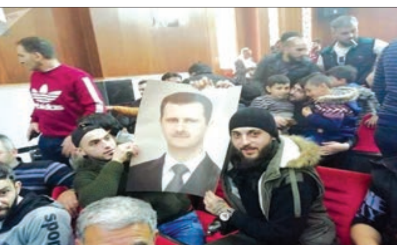
● النزلء المفرج عنهم يرفعون صورة بشار الأسد

أخلت السلطات السورية، سبيل 46 من نزلء سجن حماة المركزي بمرسوم عفو خاص من الرئيس بشار الأسد شمل 106 محكومين، وقال اللواء خالد هلال قائد شرطة محافظة حماة إن «الإفراج عن هذه الدفعة من السجناء جاء بعفو رئاسي أصدره الرئيس بشار الأسد». من جانبه قال الرئيس اللبناني ميشال عون «إن العديد من الدول شاركت في الحرب على سورية وتريد أن تحملنا النتائج». وذكرت الرئاسة اللبنانية في بيان أن ذلك جاء خلال استقبال الرئيس عون للمبعوث الخاص للأمم المتحدة إلى سورية غير بيدرسون، ونقلت الرئاسة عن الرئيس عون قوله خلال اللقاء أنه «لو خصصت هذه الدول 10% من تكاليف هذه الحرب لحل مأساة اللاجئين لكانت ساعدت في حل مشاكلهم الإنسانية وتجنيد العالم المزيد من الأزمات». وأكد عدم قدرة لبنان على تحمل تداعيات النزوح السوري على مختلف الصعد الاجتماعية والاقتصادية والحياتية، وأصبح من الضروري العمل على إعادتهم إلى المناطق الآمنة في سورية والتي باتت شاسعة ويمكنها أن تستعيد أهلها، وأشار إلى أن لبنان لم يرفض خلال سنوات الحرب السورية أي لاجئ سوري لأسباب إنسانية.