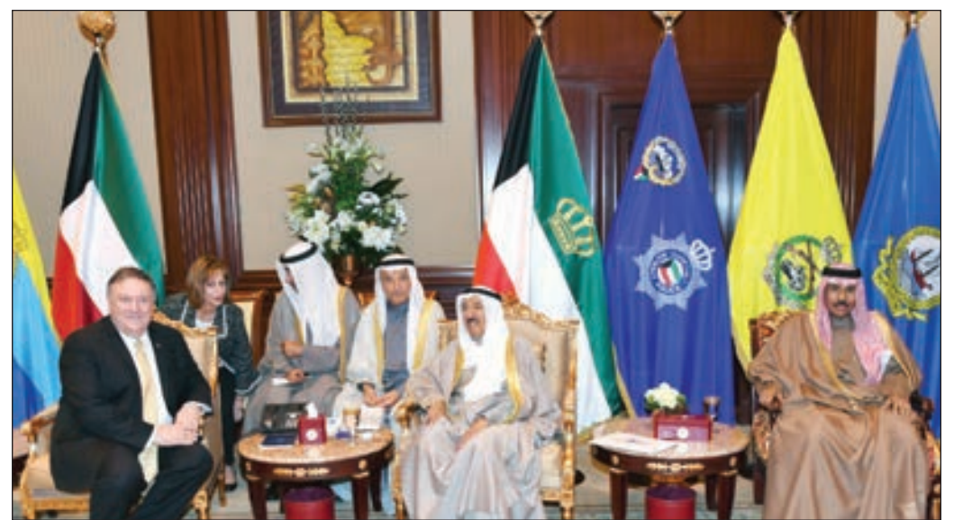
● صاحب السمو لدى استقباله وزير الخارجية الأميركي

هذا المسعى. وقال انه تم بحث الوضع في سورية والمأساة الإنسانية التي يمر بها الشعب السوري وضرورة بسط السلام والأمن والاستقرار في سورية وفق المرجعيات الدولية ذات الصلة والعلاقات الخليجية الإيرانية وجهد البلدين في مجال مكافحة الإرهاب وتطورات مسيرة السلام في الشرق الأوسط وتأكيد الجانبين على أهمية مواصلة التنسيق بين البلدين