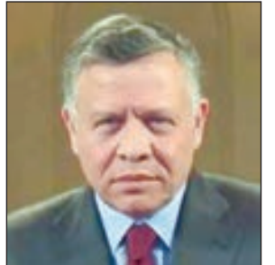
● الملك عبدالله الثاني

نفت سلطنة عمان امس الانسحاب من عضوية لجنة مشتركة بين منظمة الدول المصدرة للبترول «أوبك» ومنتجين مستقلين لمراقبة خفض الإنتاج، مؤكدة الالتزام بتقريب الفجوة بين العرض والطلب. وقال وكيل وزارة النفط والغاز