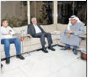
صباح المحمد استقبال الوزير الفلسطيني

● ضرورة تحقيق الأمن والاستقرار في سورية وتطورات مسيرة السلام في الشرق الأوسط بومبيو: الأزمة الخليجية ليست في مصلحة المنطقة والعالم ونحتاج إلى حلها سريعاً ● الكويت شريك استراتيجي في مواجهة الإرهاب وملتزمون بأمنها وسلامة أراضيها