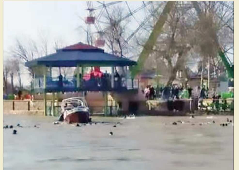
• العبارة، بعد تعرضها لانقلاب في نهر دجلة

أمر رئيس وزراء العراق، عادل عبدالمهدي، بفتح تحقيق فوري في الحادث لتحديد المسؤولين عنه ورفع نتائج للتحقيق في غضون 24 ساعة.