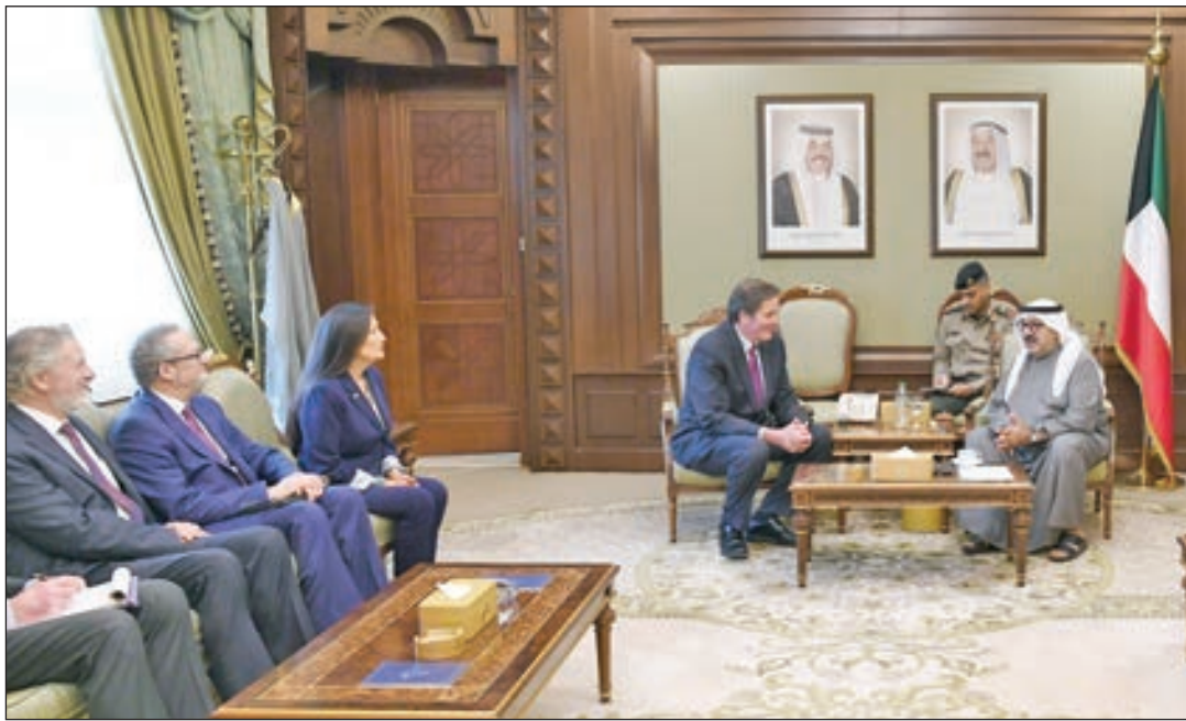
• الشيخ ناصر الصباح لدى استقباله أعضاء الكونغرس

وقالت وزارة الدفاع في بيان إن الشيخ ناصر الصباح أشاد بعمق العلاقات الثنائية بين البلدين الصديقين وحرص الطرفين على تعزيزها وتطويرها.