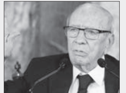
• الباجي قايد السبسي

قال الرئيس التونسي الباجي قايد السبسي إن الوضع بالبلاد خاصة الاقتصادي يئذ بالخطر داعياً إلى ضرورة التصدي لهذا التدهور واتخاذ إجراءات للحيلولة دون