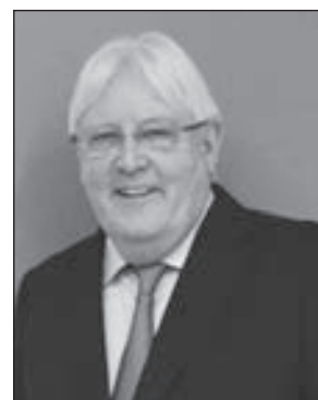
• مارتن غريفيث

كامل إقليم الجمهورية اليمنية، وعدم السماح بانتهاك حقوقها أو الانتقاص منها.