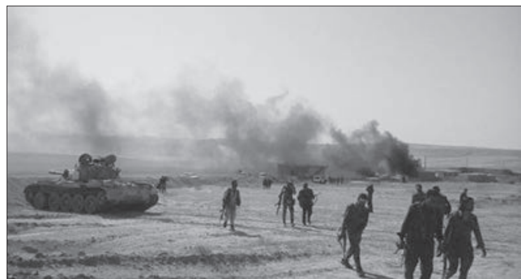
• قوات سورية الديمقراطية تواصل العمليات العسكرية

سيطرت قوات سورية الديمقراطية «قسد»، على بلدة الباغوز في ريف دير الزور الشرقي في سورية، أمس، بعد معارك عنيفة مع مسلحي التنظيم الإرهابي.