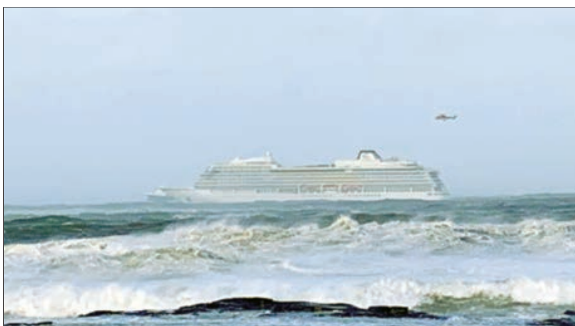
• السفينة السياحية

أفادت الشرطة وعمال إنقاذ في النرويج بأن طائرات هليكوبتر مخصصة لأغراض الإنقاذ قامت بإجلاء نحو 1300 من ركاب وطاقم سفينة سياحية تعطلت محركاتها بسبب رياح عاتية قبالة الساحل الغربي للنرويج. وقالت خدمة الإنقاذ البحري في النرويج إن السفينة فايكنغ سكاى انحرفت نحو اليابسة وأطلقت إشارة استغاثة. وأضافت أن السفينة تمكنت لاحقاً من تشغيل أحد محركاتها وأصبحت على بعد نحو كيلومترين من اليابسة ولم تعد جانحة.