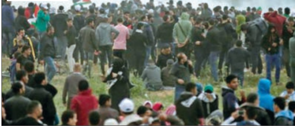
• فلسطينيون في إحدى التظاهرات... وفي الإطار مهاثير محمد

شدت روسيا على أنها ترفض تقسيم اليمن وتدعم استقراره ووحدته. وقال السفير الروسي لدى اليمن، فلاديمير بيدوشكين، إن روسيا لا ترحب بتقسيم اليمن، وتدعم بقاءه مستقرا وموحدا. جاء ذلك خلال تصريح للإعلام الرسمي، قبيل مغادرته العاصمة اليمنية المؤقتة، بعد زيارة استمرت 4 أيام. وأشاد السفير الروسي بالتحسن الأمني المتنامي الذي تشهده العاصمة المؤقتة عدن، مشيرا