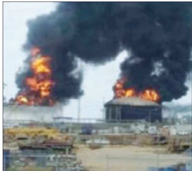
• دخان يتصاعد من موقع الانفجار

أفادت مصادر أمنية سودانية بمقتل ما لا يقل عن 10 أطفال بانفجار عبوة ناسفة في أم درمان غرب الخرطوم. ووقع الانفجار في منطقة غرب الحارات في أم درمان غرب العاصمة السودانية. وأشارت معلومات أولية إلى أن الانفجار نتج عن قنبلة يدوية. وأدى انفجار القنبلة بأم درمان غرب العاصمة السودانية