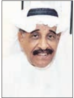
• محمد جابر

تهديها مع خالص الود للفنان الكبير محمد جابر أو العبدورسي كما يحلو للبعض تسميته لأنها الشخصية التي عرفه الجمهور بها، وكانت سببا في شهرته، ونقول له: إنك دخلت قلوبنا من خلال هذه الشخصية الكوميدية، وأنت فنان رائد لأن الريادة بدأت بك وبزملاء دريك، كونكم تخرجتم من مدرسة عميد المسرح العربي زكي طليمات، أما من كان قبلكم فجل أعمالهم ارتجالية، نتمنى أن تراك بصحة وعافية وأن تشاهد جديك، واللي ماله أول ماله تالي.