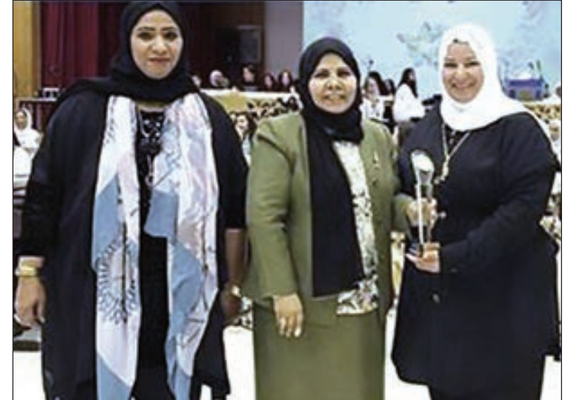
• تكريم مديرة المدرسة