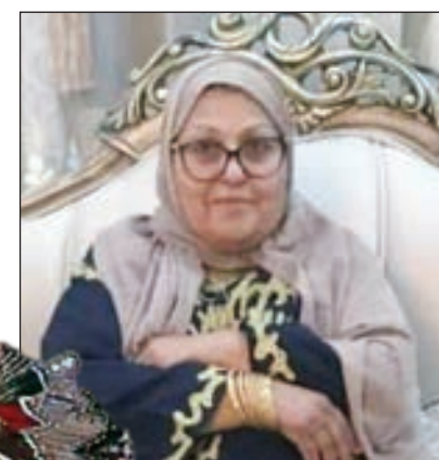
• والدة شجون