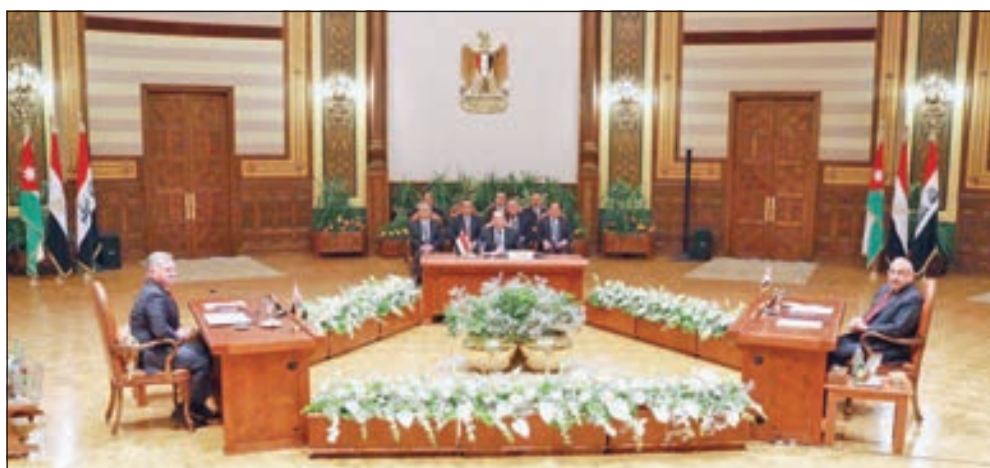
• القمة الثلاثية

أصدرت القمة الثلاثية بين مصر والأردن والعراق، أمس، بيانها الختامي، مشيرة فيه إلى أنه تم الاتفاق على مكافحة الإرهاب وداعميه بالمال أو السلاح أو المنابر الإعلامية. وذكر البيان أن الرئيس المصري عبدالفتاح السيسي ورئيس الوزراء العراقي عادل عبد المهدي والعاقل الأردني عبد الله الثاني اتفقوا على تعزيز التعاون بمجالات المناطق الصناعية والبنية التحتية وزيادة