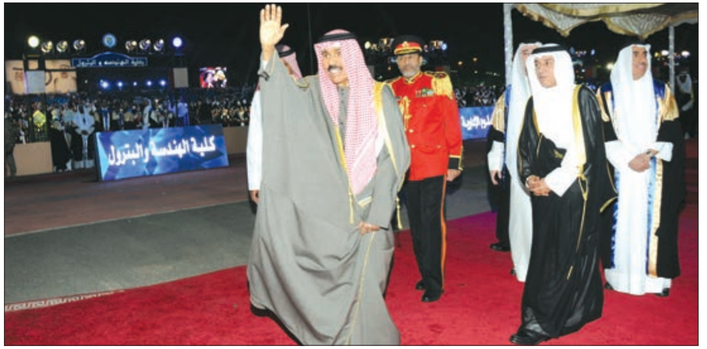
سمو ولي العهد محيياً الخريجين وأولياء أمورهم في حفل التخرج أمس

دعا سمو ولي العهد الشيخ نواف الأحمد خريجي الجامعة إلى تحسين أنفسهم ضد كل ما يتنافى مع أخلاقنا الحميدة وتقاليدينا الأصيلة، مطالباً إياهم بأن يجعلوا وطنهم نصب أعينهم، وبأن يتمسكوا بالوسطية والاعتدال لإنارة دروبهم. وكان سمو ولي العهد الشيخ نواف الأحمد رعى وحضر حفل التخرج السنوي الموحد لخريجي كلية جامعة الكويت للدفعة الثامنة والأربعين للعام الأكاديمي 2018/2017 وذلك على استاد الرياضي بالحرم الجامعي في منطقة الشويخ. وقال سموه: نحن نؤلف كوكبة جديدة من خريجي الجامعة مقدرين تحملهم المسؤولية طوال سنوات من الجهد والعناء قضاها على مقاعد الدراسة