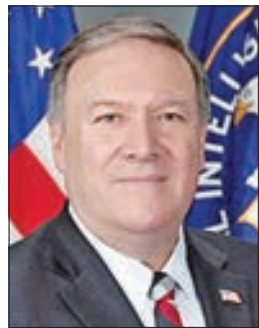
• مايك بومبيو

دعارئيس اللجنة الثورية العليا لجماعة أنصار الله، في صنعاء، الولايات المتحدة إلى خوض حرب مباشرة مع إيران، رداً على تصريحات وزير الخارجية الأمريكي، مايك بومبيو. وقال رئيس اللجنة الثورية للجماعة ان بومبيو وخارجيته اكتشفوا بعد أربع سنوات من حرب اليمن أن الحرب بالوكالة وأن إيران تضرب بالصواريخ من اليمن، حسب زعمه. وطالب بومبيو ومن خلفه بلاه بوقف الحرب والعدوان والجرائم التي يشهدها إشكال الدفاع العسكري اليمني وتنتهي