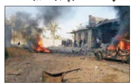
• آثار الانفجار

وأفادت مراسلة وكالة «سيونتيك» الروسية في العراق، نقلاً عن مصدر أمني بأن الانتحاريين الثلاثة كانوا يرتدون أحزمة ناسفة وتسللوا من الحدود السورية إلى ناحية القبروان التابعة لقضاء سنجار، غربي الموصل، مركز محافظة نينوى، بشمال البلاد. وأن الإرهابيين لجأوا إلى تفجير أنفسهم بعدما تمت محاصرتهم من قبل مقاتلي الحشد العشائري لمحافظة نينوى. وحتى الآن لم يتم التأكد من وقوع ضحايا مدنيين أو من مقاتلي الحشد العشائري، إثر التفجيرات.