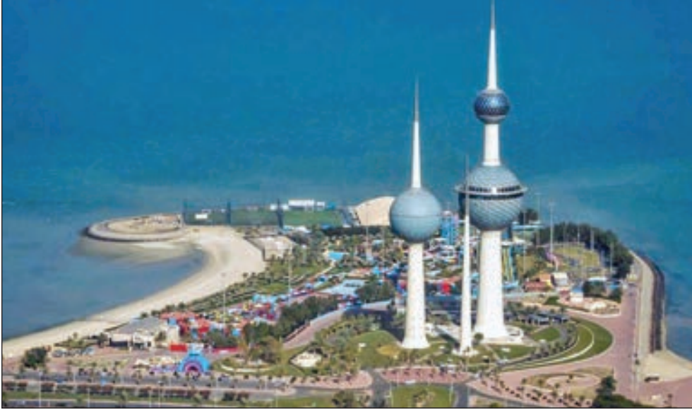
• الكويت حققت إيرادات بلغت 18.43 مليار دينار

• تحويل 3.64 مليارات دينار إلى احتياطي الأجيال المقبلة