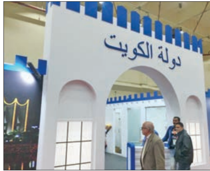
• الجناح الكويتي في المعرض