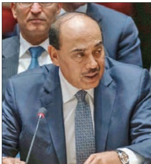
• الشيخ صباح الخالد متحدثاً في مجلس الأمن