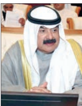
• خالد الجارالله مترشداً وفد الكويت

أكد نائب وزير الخارجية خالد الجارالله أن دول مجلس التعاون الخليجي لديها رصيد كبير من القرارات التي تم تنفيذها خدمة لمصالح دول المجلس ومواطنيه. وقال عقب ترؤسه وفد الكويت في الاجتماع الـ 19 للجنة الوزارية الخليجية المكلفة بمتابعة تنفيذ القرارات ذات العلاقة بالعمل الخليجي المشترك في العاصمة العمانية مسقط: إن تلك القرارات لم يبق منها الا ما هو قليل جداً والدائرة تضيق بحجم تلك القرارات التي تنفذ في إطار مجلس التعاون. وأضاف ان تنفيذ القرارات المتعلقة بالعمل الخليجي المشترك ما هو إلا دليل على حيوية المجلس وحرصه على هذه التجربة والحفاظ عليها واستمرارها بالعطاء لآبناء دول مجلس التعاون الخليجي، موضحاً ان اجتماعات اللجنة الوزارية الخليجية تؤكد على ديمومة عمل المجلس فضلاً عن أهمية القرارات التي يتخذها ومدى الحرص من قبل دول المجلس على تنفيذها.