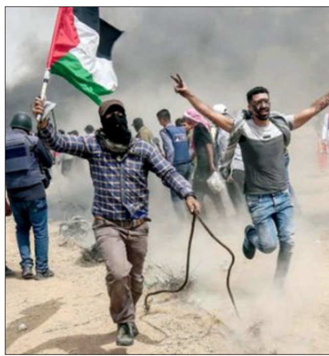
• الفلسطينيون الحزل يواجهون قوات الاحتلال