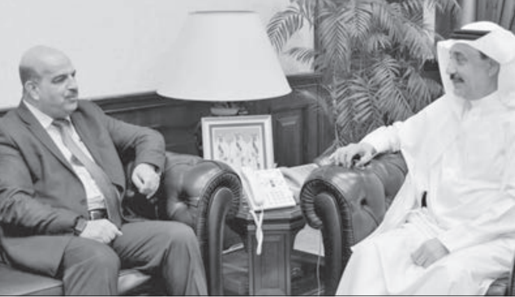
• وزير العمل ومسؤول المنظمة الدولية

وحرصه على دعم العمال وترسيخ مبادئ الحوار الاجتماعي بين أطراف الإنتاج الثلاثة، والعلاقة المتميزة التي تربط اارات المنشآت مع المنظمات النقابية، منوها بالدور الإيجابي الذي تقوم به مملكة البحرين في مجلس إدارة منظمة العمل الدولية، مؤكداً أن ذلك سوف يساعد على الاستفادة من التجارب الرائدة في مجال تعزيز بيئة العمل وحفظ حقوق أطراف الإنتاج وفق المعايير الدولية.