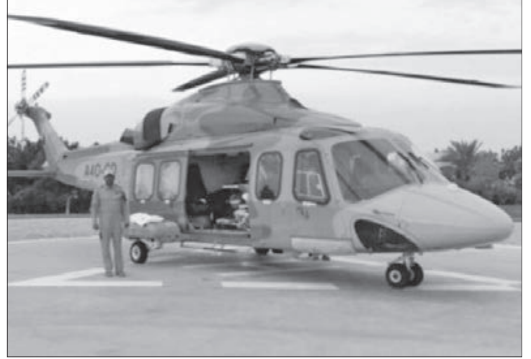
• مروحية سلاح الجو السلطاني

وأكدت الهيئة أنه تم إنزالهم جميعاً وهم بصحة جيدة. من ناحية أخرى اختيرت السلطنة نائباً لرئيس المجلس العالمي للمطارات، وذلك في الجمعية العمومية للمجلس العالمي للمطارات في اجتماعها الـ 59 في فونج كونج، وتم بالإجماع اختيار الشيخ أيمن الحوسني، الرئيس التنفيذي لمطارات عمان، نائباً لرئيس المجلس العالمي للمطارات، لمدة سنتين. ويأتي اختيار السلطنة نظير تطوير الأداء المشهود في مطارات عمان على المستوى الإداري والتشغيلي والمالي والإنجازات في قطاع الطيران المدني. ويعد هذا الاختيار إنجازاً غير مسبوق وتأكيداً لدور السلطنة المهم في قطاع المطارات على الخارطة العالمية، ويعد الحوسني أول عربي يتقلد هذا المنصب.