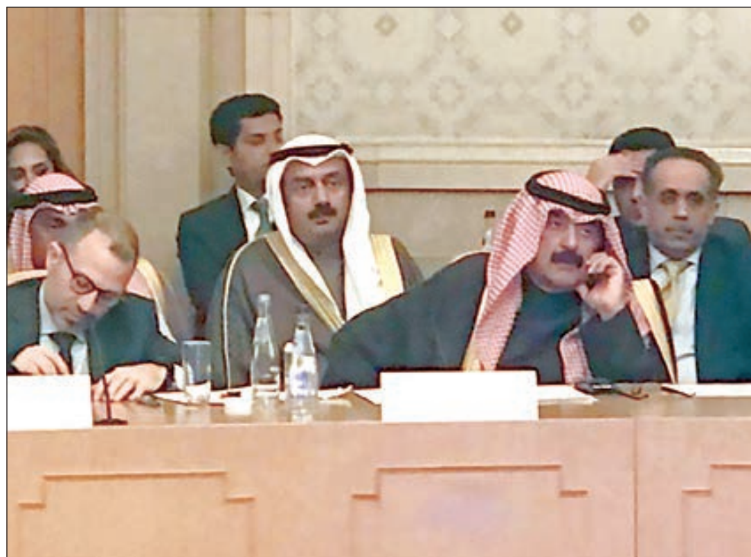
• جانب من المنتدى العربي الروسي

وأضاف: «نتطلع في الاجتماعات المقبلة لجامعة الدول العربية، أن يحقق شيء من هذا القبيل». وشد على أن الإجماع ليس ضرورياً، وأن ما تحتاجه المنطقة هو «الفهم المشترك للقرارات العربية وتفاعلها مع المجتمع الدولي، وأن هذه هي القاعدة الأساسية للعمل المشترك».