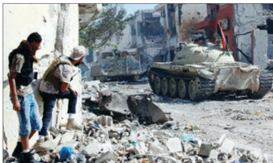
• جانب من المعارك في طرابلس