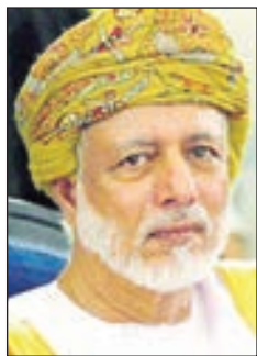
• يوسف بن علوي

أكد وزير خارجية سلطنة عمان يوسف بن علوي، أن عدم الاستقرار في دول الشرق الأوسط سببه عوامل داخلية وأخرى خارجية، وأنها منطقتا تقاطعات دولية. وقال بن علوي على هامش المنتدى الخامس للتعاون العربي الروسي المنعقد في موسكو، إن «على الدول العربية أن تتصالح مع نفسها، ليكون في إمكانها بعد ذلك أن تتصالح مع المجتمع الدولي، وهو الأمر الذي يسعى إليه الجميع».