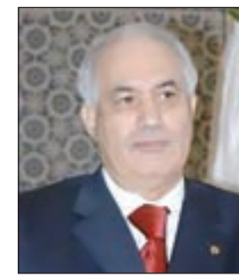
• الطيب بلعيز

قدم رئيس المجلس الدستوري الجزائري الطيب بلعيز استقالته لرئيس الدولة عبد القادر بن صالح. وأفاد بيان للمجلس الدستوري بأنه في اجتماع عقده الهيئة أمس «بلغ رئيس المجلس الدستوري الطيب بلعيز أعضاء المجلس بأنه قدم إلى رئيس الدولة استقالته من منصبه كرئيس للمجلس الدستوري، الذي باشر فيه مهامه بدءاً من تاريخ أدائه اليمين الدستورية بتاريخ 21 فبراير 2019».