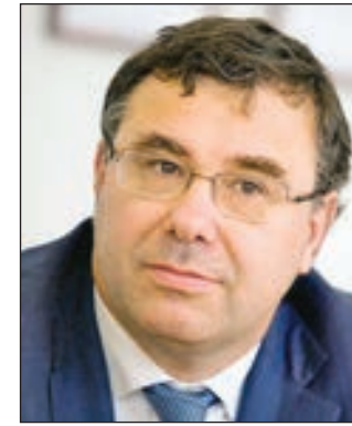
• باتريك بويان

قال باتريك بويان الرئيس التنفيذي لتوتال إن شركة النفط الفرنسية العملاقة تنتج قرابة 2.95 مليون برميل من المكافئ النفطي يومياً، بما يزيد قليلاً عن إنتاجها اليومي في العام الماضي. وبلغ الإنتاج 2.8 مليون برميل يومياً من المكافئ النفطي في 2018 بفضل تدشين عدة عمليات وزيادة الإنتاج في أستراليا وأنغولا ونيجيريا وروسيا. كما