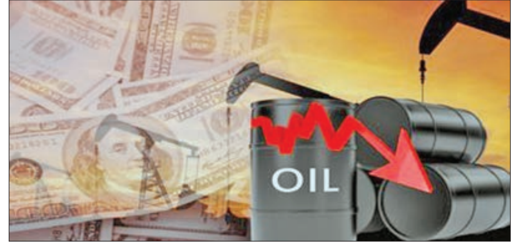
• النفط الكويتي يحافظ على مستوى أعلى من 70 دولاراً

انخفض سعر برميل النفط الكويتي 24 سنتاً في تداولات أول أمس ليبلغ 71.36 دولاراً أميركياً مقابل 71.60 دولاراً للبرميل في تداولات الأربعاء وفقاً للسعر المعلن من مؤسسة البترول الكويتية. وفي الأسواق العالمية أنهت