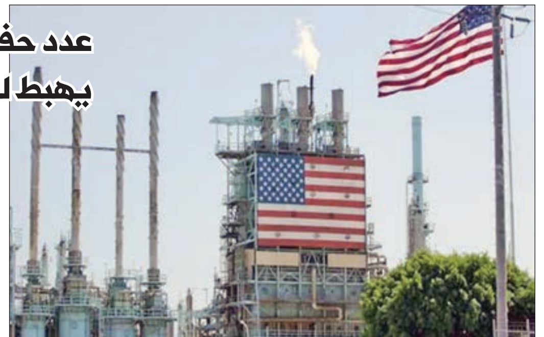
• تراجع إنتاج أكبر حقول للنفط الصخري في أميركا

خفضت شركات الطاقة الأميركية عدد حفارات النفط العاملة للمرة الأولى في ثلاثة أسابيع مع استمرار انكماش التوقعات لنمو الإنتاج في أكبر حقول النفط الصخري في الولايات المتحدة. وقالت شركة بيكر هيوز لخدمات الطاقة في تقريرها الأسبوعي، إن شركات الحفر أوقفت تشغيل ثمانية حفارات نفطية هذا الأسبوع لينخفض العدد الإجمالي إلى 825. وما زال إجمالي عدد حفارات النفط النشطة في الولايات المتحدة، وهو مؤشر أولي للإنتاج مستقبلاً، أعلى قليلاً من مستواه قبل عام عندما كان هناك 820 حفاراً قيد التشغيل. وتراجع عدد الحفارات على مدار