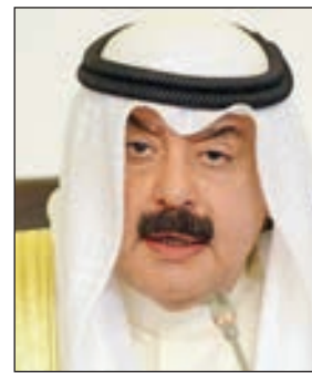
• خالد الجارالله

أكد نائب وزير الخارجية خالد الجارالله، أن الكويت تسعى من مطلق مسؤولياتها الدينية والأخلاقية والإنسانية إلى العمل بكل جهد لمواجهة آثار الكوارث الإنسانية في العالم، لاسيما التي وقعت في إقليم العربي. وأضاف في كلمة ألقاها في افتتاح الاجتماع الـ 44 للمنظمة العربية للهلال والصليب الأحمر أمس، الذي ينعقد تحت شعار «مبادئنا تجمعنا»، أننا نعيش في محيط جغرافي ضمت حدوده صراعات ونزاعات قتلت ودمرت وشربت فشلت بتبعاتها كوارث إنسانية غير مسبوقة في عالمنا المعاصر عملت معها الدول والمنظمات الدولية والإقليمية لتفادي آثارها وللجهد تبعاها ورفع معاناة الإنسان في هذا المحيط. وقال إن الكويت استضافت عدداً من مؤتمرات المانحين وشاركت في رئاسة عدد آخر منها وساهمت في تقديم المساعدات الإنسانية السخية التي أطلقت معها الأمم المتحدة على الكويت مركزاً للعمل الإنساني وعلى سمو أمير البلاد الشيخ صباح الأحمد، قائداً للعمل الإنساني انطلاقاً من عملها في إطار ما تؤمن به من ثواب راسخة ومبادئ في مجال دعم وتعزيز العمل الإنساني العالمي.