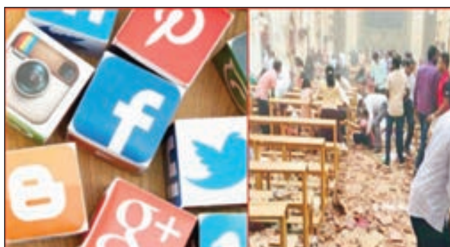
• مواقع التواصل الاجتماعي سبب الإرهاب في العالم

أخر الإحصاءات بارتفاع حصيلة القتلى في سريلانكا إلى 290 قتيلًا، وإصابة نحو 500 آخرين. وقالت صحيفة «الغارديان» البريطانية إن قرار حكومة سريلانكا بحظر جميع مواقع التواصل الاجتماعي سبب الإرهاب في العالم. وقالت صحيفة «الغارديان» البريطانية إن قرار حكومة سريلانكا بحظر جميع مواقع التواصل الاجتماعي سبب الإرهاب في العالم.