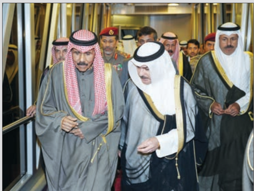
• سمو ولي العهد لدى عودته