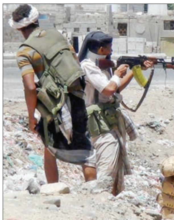
• جانب من المواجهات العسكرية في ضواحي طرابلس

وصفت اللجنة الدولية للصليب الأحمر الوضع حول العاصمة الليبية طرابلس بأنه متدهور للغاية، مؤكدة أن المناطق المكتظة بالسكان تحولت تدريجياً إلى ساحات قتال.