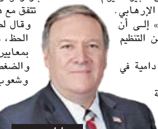
• مايك بومبيو