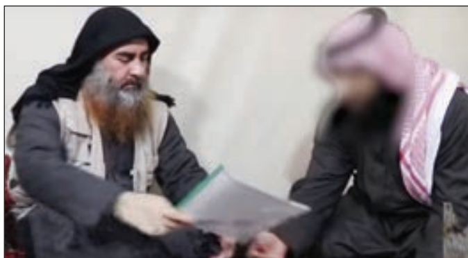
• البغدادي وإلى جانبه صاحب الزي العربي الخليجي

البغدادي صوتاً وصورة بعد أن روجت وسائل إعلام أميركية أنه لقي حتفه منذ خمسة أعوام؛ وهل سيعاد إنتاج التنظيم الإرهابي من جديد بعد الانتكاسات التي تعرض لها في العراق وسورية؛ وما الدولة التي سوف يحط داعش رحاله فيها، ليبدأ الفيلم الهوليودي من جديد؟ وأشار الفيديو الذي أنتجته «الفرقان» التابعة للتنظيم الإرهابي وبيته مواقع أميركية، تساؤلات عدة منها من هو صاحب الزي العربي الخليجي الذي كان يقدم ملفات للبغدادي؟ فمن هو هذا الشخص، ومن يمثل وأي دولة؟ فمن المؤكد أن هذه الرسالة «مشفرة» لجهة ما كما رصدها المراقبون. ويتساءل المراقبون: لماذا عاد البغدادي في هذه الظروف بعد أن اختفى وقيل إنه قتل، وظهر بلباس الخوارج سابقاً، عمامة ولثامة وملابس قففاضة، وإلى جانبه «خليجي» يجلس على طريقة جلوس العرب.