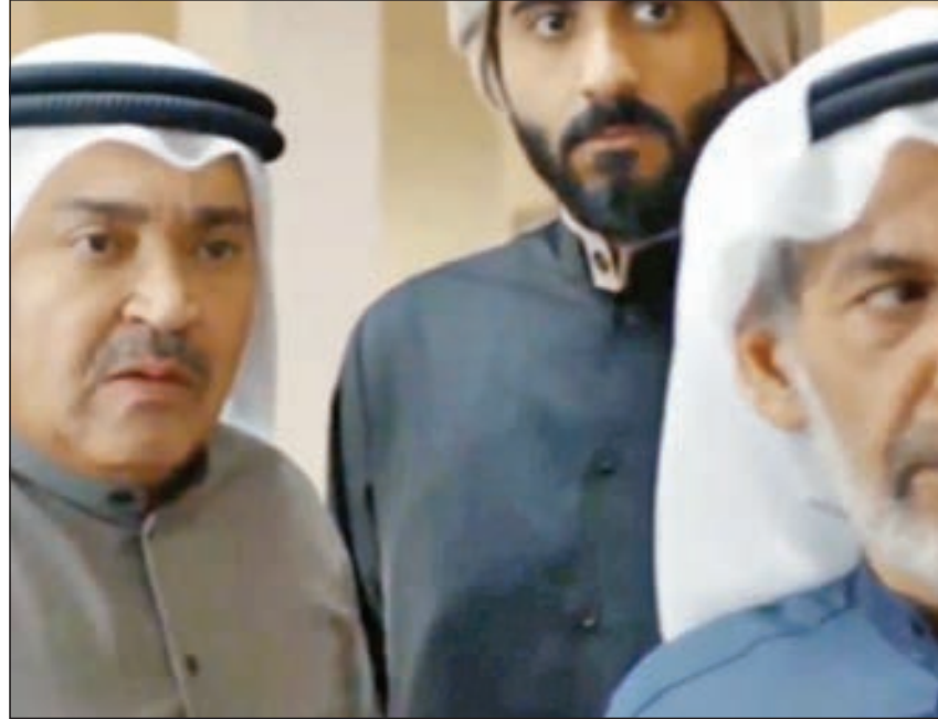
• أبطال المسلسل