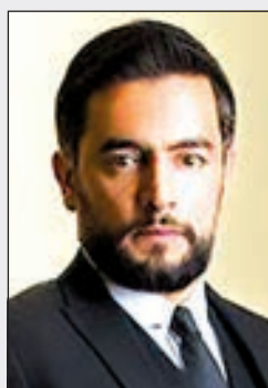
• هاني سلامة