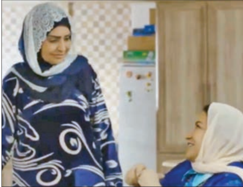
• لقطات من مسلسل أنا عندي نص