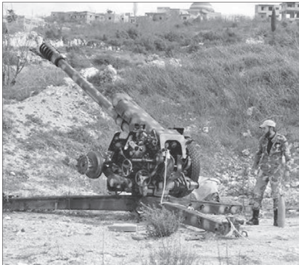
• قوات الجيش السوري ترد على خروقات الإرهابيين

وروياسة اسكندر في محافظة اللاذقية». وأوضح أن مركز المصالحة دعا قادة الجماعات المسلحة غير الشرعية، إلى التخلي عن الاستنزافات، واتخاذ طريق التسوية السلمية للوضع في المناطق الخاضعة لسيطرتهم.