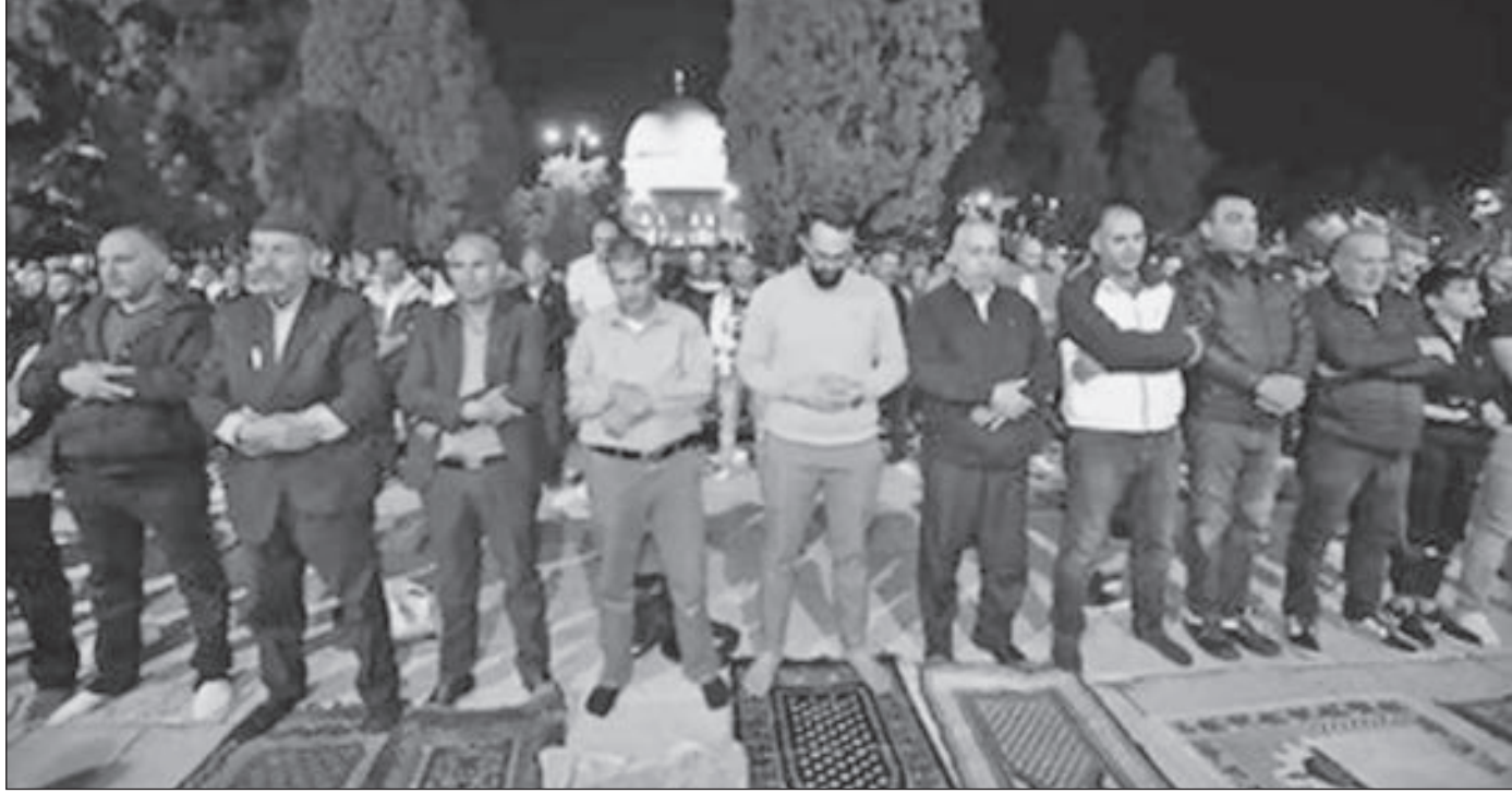
• صلاة التراويح من أمام المسجد الأقصى

ويعد الاحتلال في أغلب قرى وبلدات الضفة الغربية الواقعة في منطقة «ج» على وضع بوابات إسمنتية يديرها ويتحكم بها جنود الاحتلال، حيث تعمل هذه البوابات على تحويل