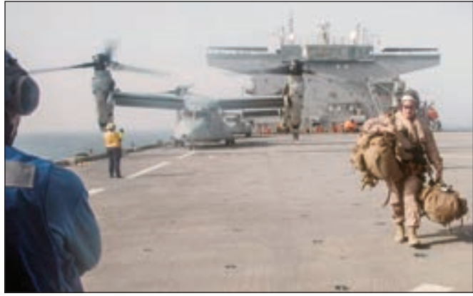
• حاملات طائرات في المياه الإقليمية

الخاصة بالأمن البحري عقد في مقر القيادة المركزية للقوات البحرية الأميركية في المنامة، مؤكدة أن الاجتماع يضمن أمن واستقرار الملاحة البحرية وحرية حركة التجارة، في الشرق الأوسط. وثاني هذه التطورات في الوقت الذي تشهد فيه منطقة الخليج تصعيدا ملموسا بين إيران والولايات المتحدة.