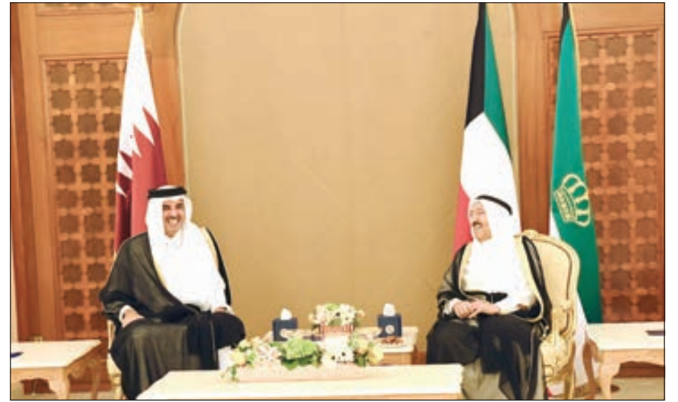
• صاحب السمو مستقبلاً أمير قطر

الراسخة بين البلدين والشعبين الشقيقين وسبل تعزيز وتنمية مسيرة التعاون الثنائي بين البلدين الشقيقين وذلك على كل الأصعدة، بما يخدم مصالحهما المشتركة، كما تم استعراض القضايا ذات الاهتمام المشترك وآخر المستجدات على الساحتين الإقليمية والدولية.