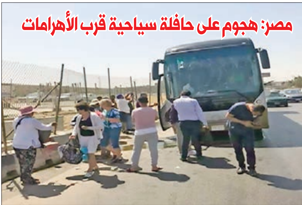
• عدد من السياح أمام الحافلة بعد الانفجار

يأتي هذا التصريح ردا على ما أعلنته ماي عن التزامها ادخال تعديلات على الاتفاق قبل عرضه على نواب مجلس العموم في الأسبوع الأول من يونيو المقبل بعد ان رفضوه في ثلاث مناسبات متتالية.