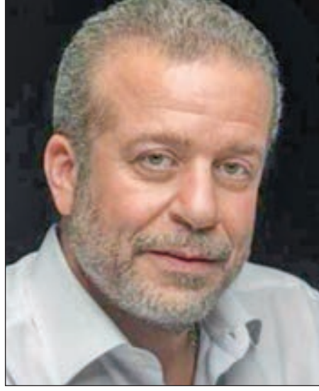
• شريف منير