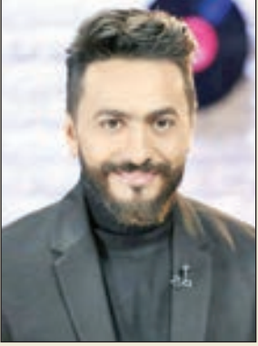
• تامر حسني

يستعد الفنان تامر حسني لحظه الغنائي الأول على مسرح أوبرا دبي، وذلك ضمن فعاليات احتفالات دبي بعيد الفطر المبارك. ومن المقرر أن يقام الحفل يوم الخميس 6 يونيو، على أن يبدأ الحفل في تمام الساعة الـ 9 بتوقيت الإمارات.