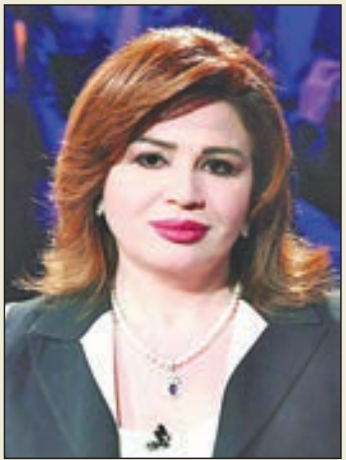
• إلهام شاهين

كشفت النجمة إلهام شاهين، عن السبب وراء ترددها على أحد الأطباء النفسيين، وذلك خلال لقاء أجرته مع الإعلامية بيسمة وهبة، ببرنامح «شيخ الحارة»، الذي يبذع على إحدى الفضائيات.