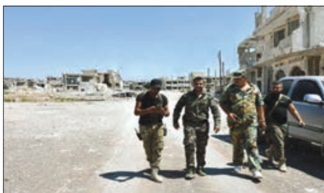
عناصر من الجيش السوري في كفر زيتا بريف حماة بعد القضاء على الإرهابيين

سيطر الجيش السوري، أمس، على بلدات وقرى عدة في ريف حماة الشمالي ومنها مورك ومحيطها، حيث توجد نقطة المراقبة التركية التاسعة، في إطار تقدمه لتحرير ريفي حماة وإدلب من المسلحين. وفرض الجيش طوقاً حول نقطة المراقبة التركية التاسعة، تزامناً مع بسط سيطرته على قرى وبلدات البويزة ومعركة والحايا ومورك في الريف الشمالي لحماة. وأعلنت القيادة العامة للجيش والقوات المسلحة أن القوات المسلحة واصلت في شمالي حماة وجنوب إدلب تقدمها الميداني وبحر التنظيمات الإرهابية المسلحة التي كانت تتركز في المنطقة بعد تكبيدها خسائر فادحة في الأرواح والمعدات، وبعد ضربات مكثفة على مدار الأيام السابقة وإحكام الطوق على ريف حماة الشمالي كاملاً تمكن جنودنا الشجعان من تطهير البلدات والقرى التالية: خان شيخون مورك اللطامنة