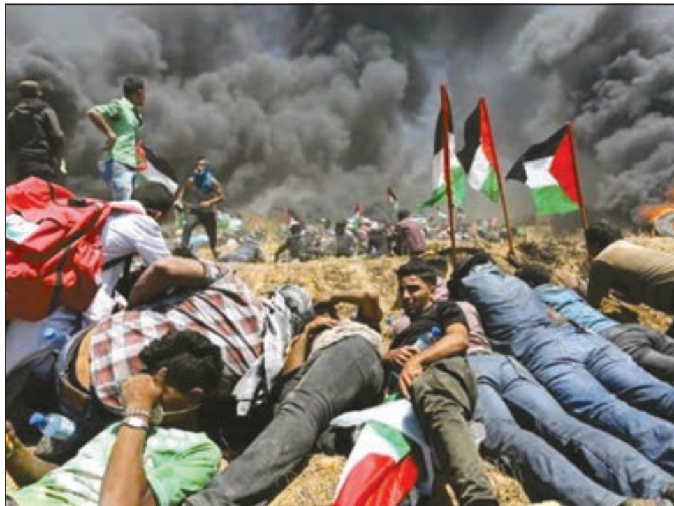
فلسطينيون أثناء المواجهة مع الاحتلال في يوم الغضب

أكدت الكويت أهمية ضمان المساءلة ومحاسبة المسؤولين عن استهداف المدنيين بأي شكل من ذلك مرتكبو الهجمات ضد الأقليات الدينية وإدانة جميع انتهاكات حقوق الإنسان في أي نزاع. وقال مندوب الدائم لوفد الكويت لدى الأمم المتحدة بدر المنيع في جلسة عقدها مجلس الأمن، إن فريق التحقيق الأممي لتعزيز المساءلة في الجرائم المرتكبة من قبل التنظيم الإرهابي في العراق «يعد خطوة في الاتجاه الصحيح». وأعرب المنيع عن تضامنه مع الضحايا والتاجين من تلك الأفعال «البيغضة المدفوعة بالتمييز الديني التي تستهدف جميع الأقليات الدينية وخصوصاً المسلمين والمسيحيين» وأحدثها «الهجوم المأساوي على المسجد بمدينة «كرايستشيرس» في نيوزيلندا واستهداف الشريحة المسيحية في سريلانكا خلال عيد الفصح. وأشار إلى أن للأمم المتحدة وخاصة مجلس الأمن دوراً مهماً في هذا الصدد من خلال الإدانة المستمرة للاضطهاد المنهجي للأقليات أينما وقعت بالإضافة إلى ضمان التنفيذ الكامل لقرارات المجلس ذات الصلة لا سيما في سياق حماية المدنيين ومن خلال عمليات حفظ السلام وتعزيز آليات الإنذار المبكر لما لها من أهمية. ص3