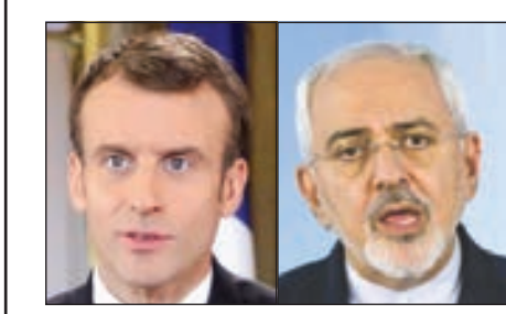
محمد ظريف • إيمانويل ماكرون

وصف وزير الخارجية الإيراني، محمد جواد ظريف، مباحثاته مع الرئيس الفرنسي إيمانويل ماكرون بسالفة. وقال ظريف لدى لقائه بـماكرون في باريس أمس: «بحثت مع الرئيس الفرنسي تطبيق الاتفاق النووي والخطوات التي ينبغي بذلها، ونحن مع استمرار المباحثات لأجل تطبيق الاتفاق النووي». وأوضح ظريف أنه بحث مع الرئيس الفرنسي حرية طرق الملاحه الدولية، مؤكداً على «ضرورة أن تكون الملاحه آمنة للجميع». وأشار وزير الخارجية الإيراني إلى أن «طهران هي الضامن الأقوى للملاحه الدولية في مياه الخليج ومضيق هرمز وخليج عمان». وقال ظريف: «قدمت لنا فرنسا مقترحات وقدمنا مقترحات من كيفية تنفيذ الاتفاق النووي» والخطوات التي ينبغي للجانبين اتخاذها» وتابع: المحادثات كانت طيبة ومثمرة، والأمر بالقطع يعتمد على كيفية تنفيذ الاتفاق الأوروبي لالتزاماته داخل «الاتفاق النووي» وأيضاً الالتزامات التي قطعها بعد خروج أميركا. ونقلت الوكالة عن ظريف قوله إن من غير الممكن إعادة التفاوض على الاتفاق النووي.