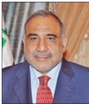
• عادل عبد المهدي

إلى ذلك قالت مفضية الشؤون الخارجية في الاتحاد الأوروبي: «يشكل الهجوم الذي نفذ بطائرات من دون طيار، على منشأتين نفطيتين في السعودية، تهديداً حقيقياً للأمن الإقليمي. وفي الوقت الذي يتصاعد فيه التوتر في المنطقة، يقوض هذا الهجوم استمرار العمل في نزاع فتيل التصعيد وتعزيز الحوار». ودعا الاقتصاد الأوروبي، إلى «إثبات الوقائع وتحديد المسؤولية»، بوضوح في هذا الهجوم.