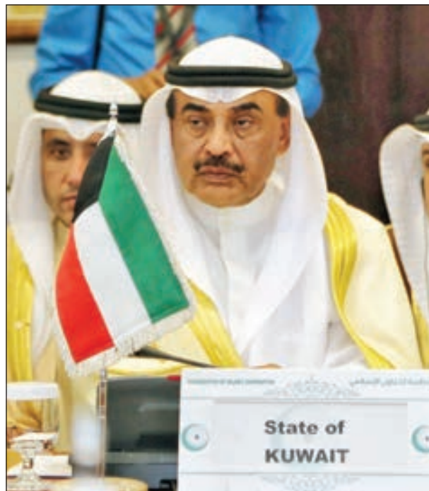
• الشيخ صباح الخالد في مؤتمر التعاون الإسلامي