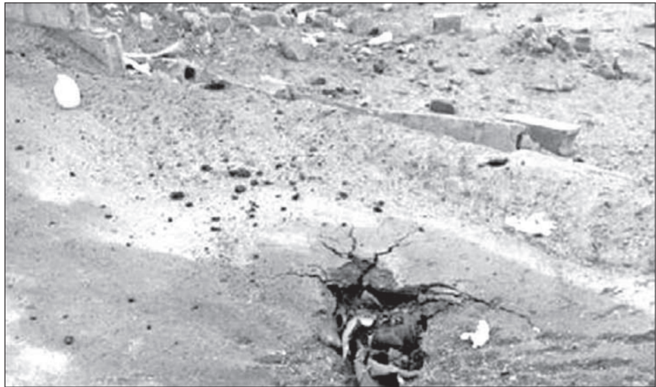
• طهران مستهدفة من الحوثيين وقوات صالح

السعودية ردت بقوة وكثافة على مصدر تلك القذائف داخل عمق محافظة صعدة اليمنية، خاصة مواقع الطلح ومران ونقعة والمعابن، فيما شنت طائرات الأباتشي والـ «إف ١٦» عدداً من الغارات المركزة على مواقع توجد مسلحي الحوثي والمخلوع صالح وتدميرها.