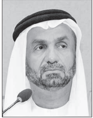
• أحمد الجروان

أدان رئيس البرلمان العربي أحمد بن محمد الجروان بشدة التدخل الإيراني السافر في الشؤون الداخلية لمملكة البحرين وعدد من الدول العربية، إثر التصريحات التي صدرت مؤخراً عن القيادة الإيرانية خلال عيد الفطر المبارك.