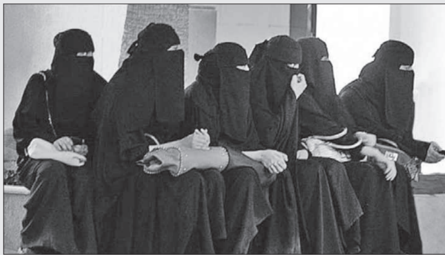
• ربات البيوت يُشكلن نصف السكان السعوديين خارج العمل

ملايين سعودي في سن العمل هم خارج سوق العمل. وأوضحت وزارة الاقتصاد